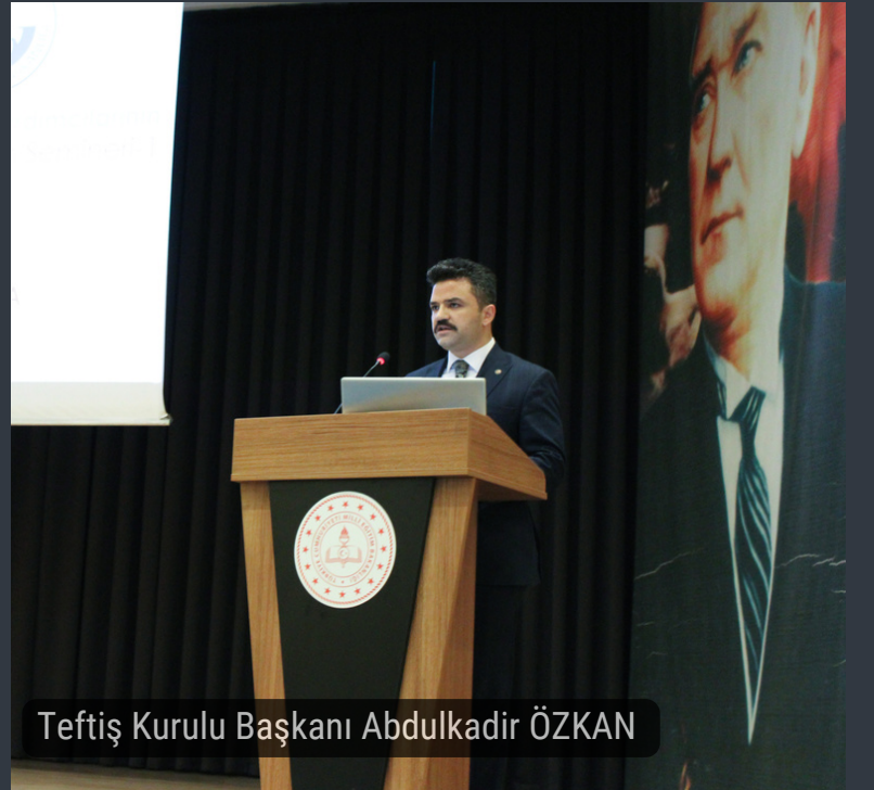
Teftiş Kurulu Başkanı Abdulkadir ÖZKAN